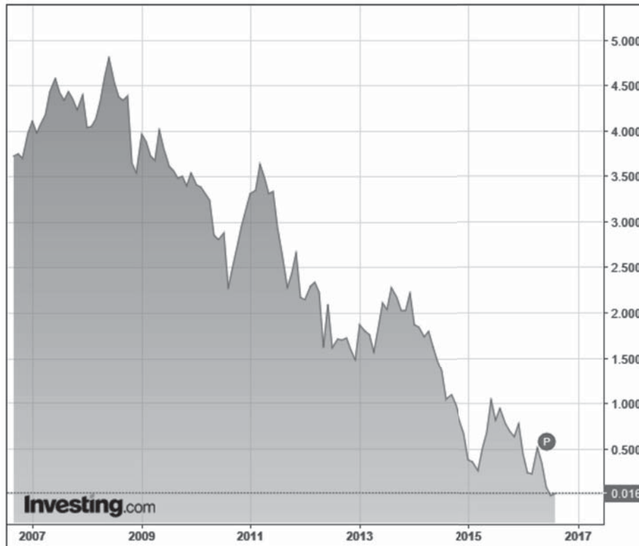
Figuur 1: verloop van de 10-jaars Nederlandse staatsobligatie

Nederland 10-Jaar, Nederland, Amsterdam:NL10YT=RR, M